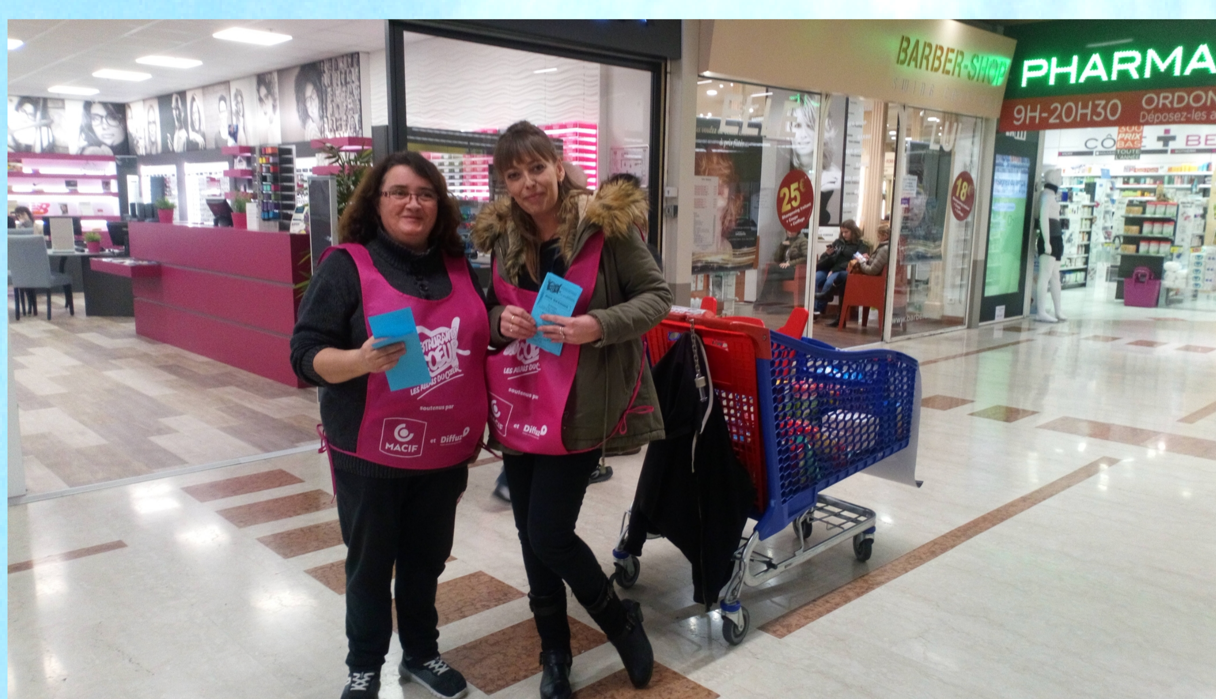
La participation à des collectes de la banque alimentaire de l'Hérault.

Depuis 2018, particulièrement avec les résidents des foyers d'APSH34, de la Résidence Accueil de Grabels et avec les adhérents du GEM Lesseps, notre association accompagne les personnes vers des activités leur permettant de rencontrer dans le quartier des femmes et des hommes, eux-mêmes investis dans des actions associatives.