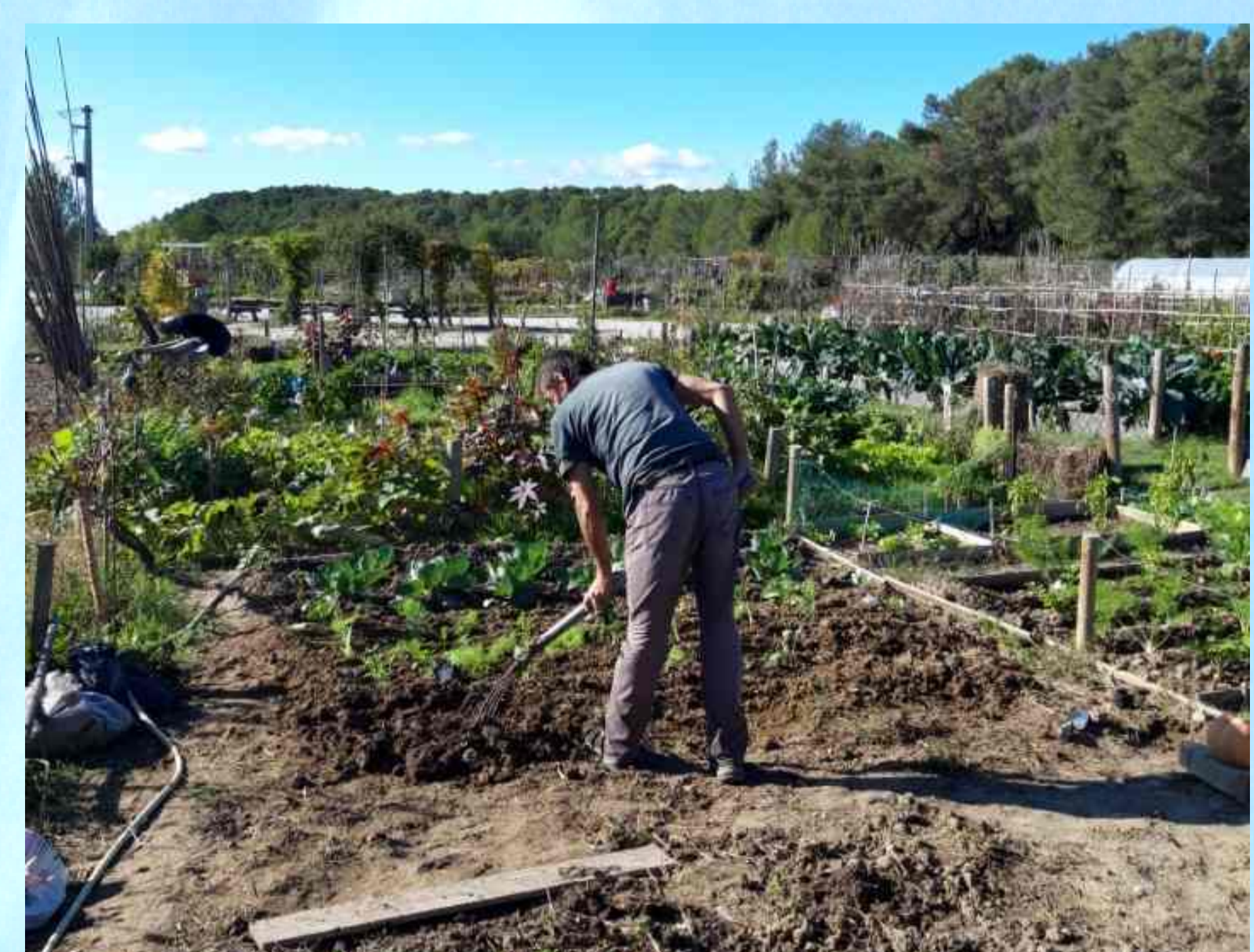
L'implication dans le jardinage de parcelles au sein de l'association des jardins familiaux de Clapiers ( Al Ort )

Vous avez des compétences, vous avez des idées, vous êtes investis dans le milieu associatif .... Rejoignez-nous, nous avons besoin de volontaires !