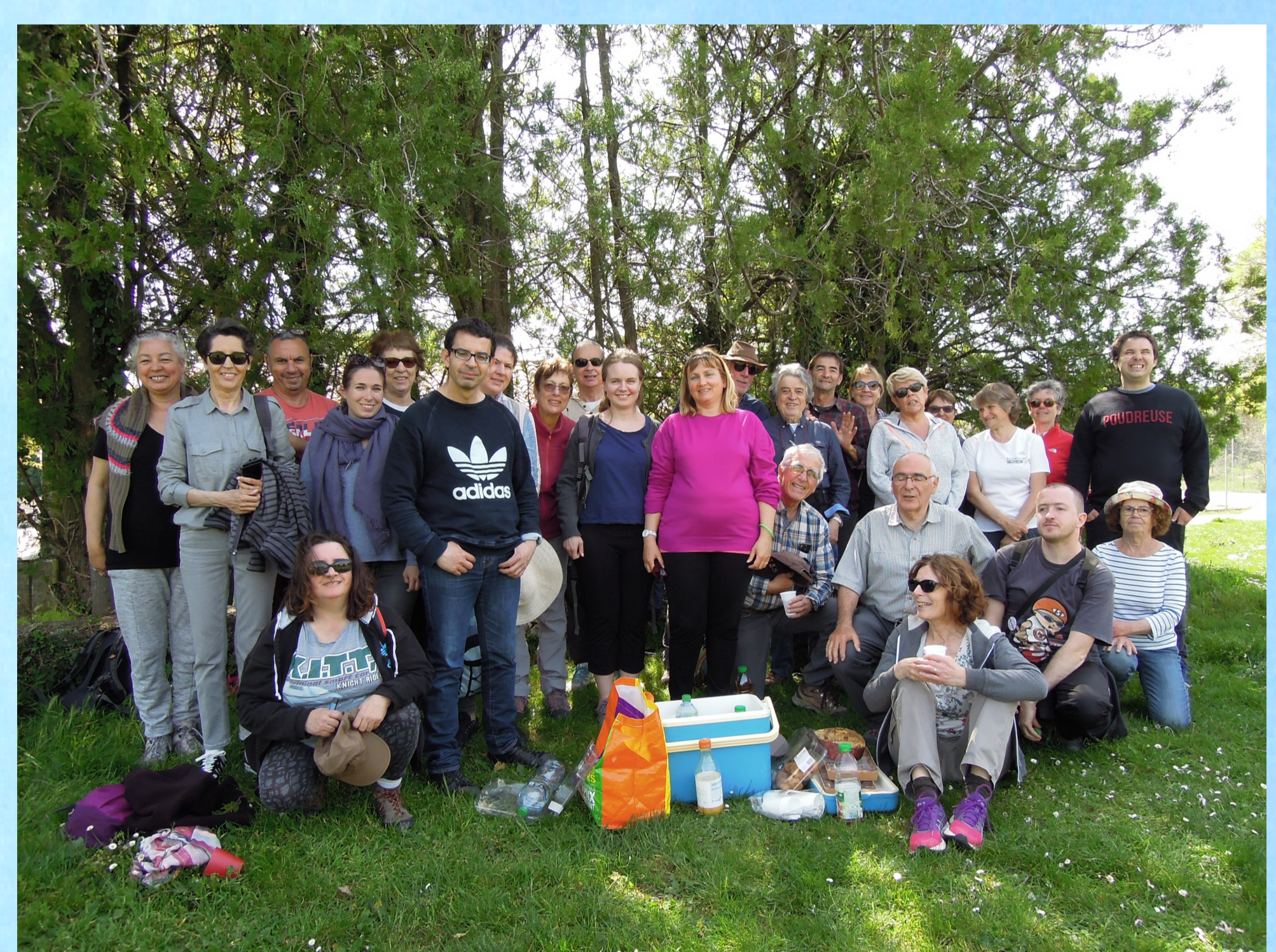
Des randonnées « Marchons ensemble »